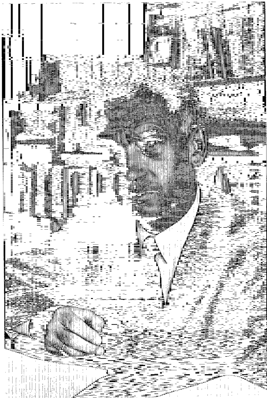
Dr. Ernst Mayr