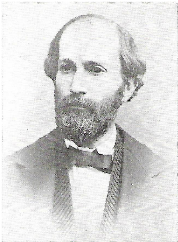
MANUEL VICENTE DIAZ (RETRATO TOMADO ALREDEDOR DEL AÑO 1870)